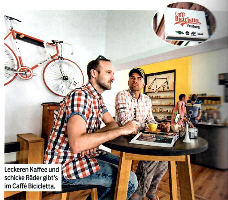
Leckeren Kaffee und schicke Räder gibt's im Caffè Bicletta.

➔ On Tour mit den Rigs: Die Radsport Interessens Gemeinschaft Freiburg (RIG) fehlt bei keinem wichtigen Radsport-Event der Nation. Wer in Freiburg weilt, kann mittwochs oder am Wochenende mit den Jungs und Mädels auf Tour gehen. www.rigfreiburg.de